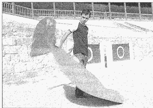
El joven demostró ayer su destreza con el capote en el coso riosecano.

Hay que tener arte, para transmitir a la gente y que el público