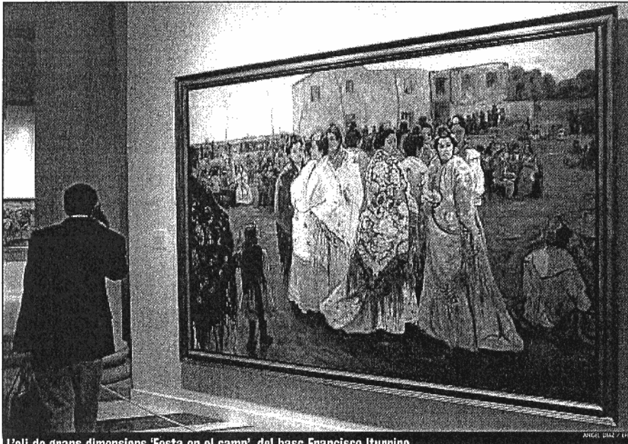
L'oli de grans dimensions 'Festa en el camp', del basc Francisco Iturrino