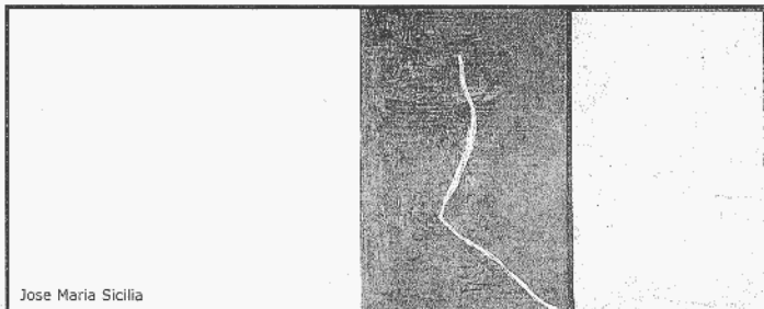
Jose María Sicilia