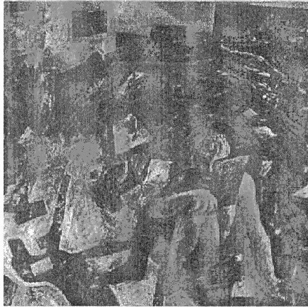
'Pintor damunt el quadre', M. Barcelo