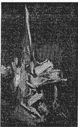
Obra de Viola

fronteras. La participación en la Bienal de Venecia en el 64, las diversas antológicas realizadas por el Museo de Arte Contemporáneo de Madrid y el Museo Provincial de Cádiz, entre otras, son acontecimientos que refuerzan la obra en solitario de Viola durante aquellos años de madurez. Entre sus títulos más destacados, El Crepúsculo de los Dioses , una pintura acusadamente horizontal, es quizá la más temprana de la muestra. Frente a ésta, la casi vertiginosa verticalidad de La Victoria , pintada dos años después, da paso a obras posteriores que ilustran los años finales de Manuel Viola, como la titulada Tempstead , de 1978. Todas ellas de formato medio. Además, la exposición cuenta con varios óleos sobre tablex, soporte que, junto al lienzo, fue usual en el trabajo del artista.