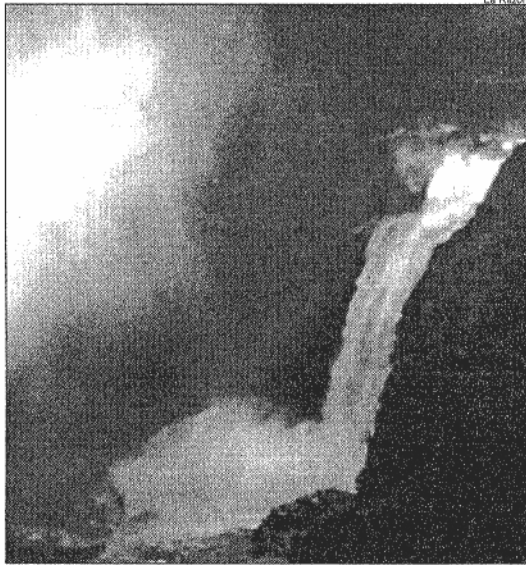
Una panorámica del Pozo de los Humos en los Arribes del Duero

ñas guardan una ancestral historia como dan testimonio diversas pinturas rupestres, dólmenes, verracos de piedra, estelas romanas y otras inscripciones hallados en muchos de ellos y que hablan también de la invertebrada historia de esta comarca.