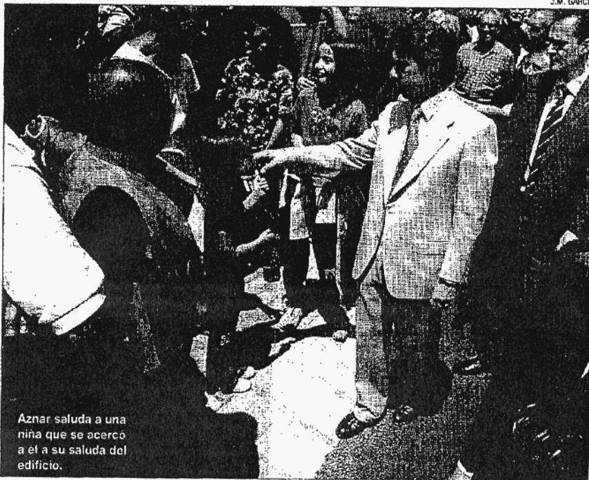
Aznar saluda a una niña que se acercó a él a su salida del edificio.

En la comida, los ocho comensales degustaron jamón de la tierra y patatas meneás. De segundo, a elegir. El presidente degustó carne de morucha y Ana Botella, una lubina. Todo