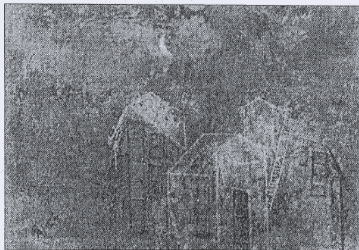
Obra de Margarita Gámez

Pintora interesada por el paisaje y el entorno, Margarita Gámez encuentra su génesis en la realidad para llegar a una sintetización vigorosa desarrollada sobre cultivos informalistas de alto valor cromático. Podemos intuir que parte del secreto de su buen hacer pictórico, secreto que en su totalidad sólo conoce la propia pintora, se encuentra en dar la misma importancia a lo sugerido y a lo desarrollado. Para la artista bastan un par de trazos para situar en un nivel de sugerencia plástica el motivo más humilde y elemental, y a su vez es capaz de representar las más complejas calidades con exquisito rigor. Todo ello hace del tra-