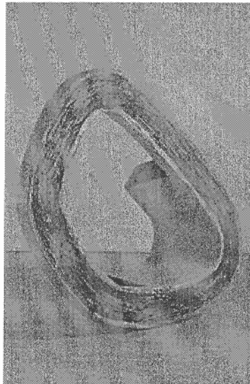
Richard Deacon. Sin título, 1987

La antigua capilla de los Condes de Fuensaldaña corresponde a la actual Sala 11. En ella se exhibe un ejemplo típico del arte povera: el iglú de Mario Merz (Milán, 1925). Con título "Sentiero per qui" (El camino para venir aquí), esta obra de enormes proporciones fue realizada en 1986 utilizando piedras, periódicos, hierro, cristales y neón.