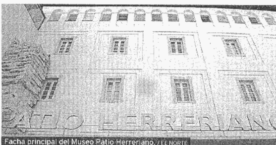
Fachada principal del Museo Patio Herreriano.

Museo de Santa Isabel. Encarnación, 6. ☎ 983 352 139. Viernes y sábados de 11 a 13 h. Sólo grupos de lunes a sábado, de 1 a 18.30, concertando cita. Museo de San Joaquín y Santa Ana. Pza. Santa Ana, 4. ☎ 983 357 672. Lunes a viernes, 10 a 13.30 y 17 a 20. Sábado y festivos 10 a 14.30. Museo Oriental. Paseo Filipinos, 7. ☎ 983 306 800 y ☎ 983 306 900. De lunes a sábado, 16 a 19. Dom. y festivos 10 a 14. MUYA (Museo de la Universidad). Palacio de Santa Cruz, Sala de San Ambrosio. Plaza Santa Cruz, 8. ☎ 983 423 240. Se puede visitar de lunes a sábado, de 12.00 a 14.00 y de 18.00 a 21.00 horas. Visitas guiadas, a las 13.00 y 19.00 horas. Museo Fundación Cristóbal Gabarrón. Calle Rastrojo, cv/Barbecho. ☎ 983 362 490. De martes a viernes, de 11 a 14 y de 16 a 20 h. Sábados y domingos, de 11 a 14 horas. Casa-Museo de Cervantes. Rastrojo, s/n. ☎ 983 308 810. Cerrado por remodelación hasta mediados de abril del 2005. Museo Academia de Bellas Artes. (Casa Museo Cervantes). Museo de Ciencias Naturales. Plaza España, 7. ☎ 983 21 1 609. Grupos, cita concertada: martes a viernes, de 9 a 13. Visitas sin cita previa sábados, de 11 a 13. Museo Diocesano y Catedralicio. Arribas, 1. ☎ 983 304 362.