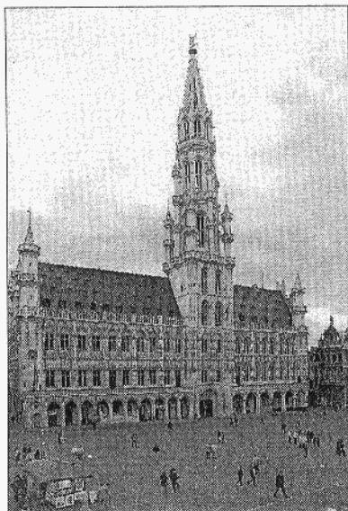
"Grand Place, Bruselas", de Ángel Marcos

• Palacio de Abrantes. C/ San Pablo, 26.