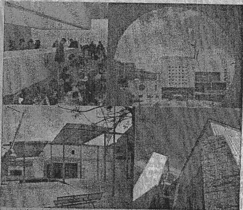
De izda. a dcha. y de arriba a abajo: MARCO, Artium, EACC y Patio Herreriano.