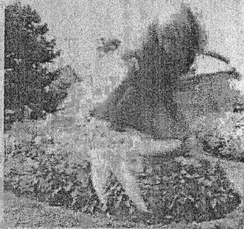
Galeria Friedriech Bassel.