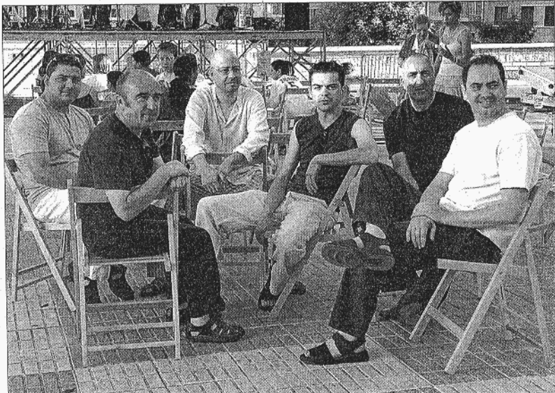
El grupo de folk vallisoletano, Tradere, actúa esta noche en San Benito.

La verdad es que sí. La verdad es que cuando te paras a comparar las reacciones de un público con otro, te das cuenta de que fuera de Valladolid, la gente se siente más agradecida, nos aco-