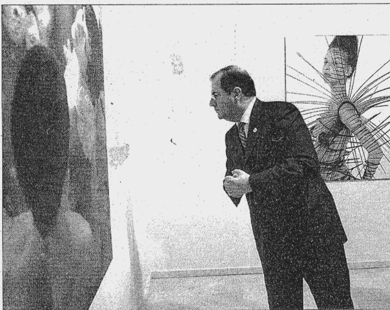
Juan Vicente Herrera, presidente de la Junta, observa una obra del 'The real Royal Trip. El retorno'.

Alrededor de cien instalaciones, vídeos y fotografías se unen por el tercer viaje que realizó Cris-tóbal Colón a América, principal excusa de la muestra. Además, la