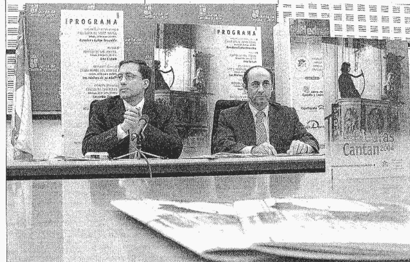
Presentación del ciclo de conciertos.