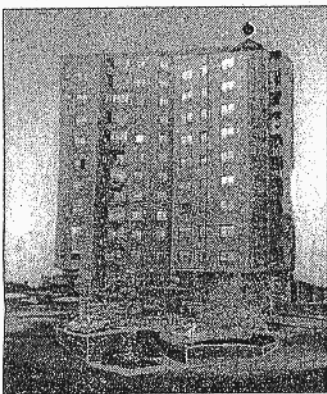
"Edificio y burro taxi", de Ugalde

La muestra de Juan Ugalde, titulada "Parques Naturales" recorre la trayectoria del artista bilbaíno desde 1922 hasta el momento actual. Ya en los inicios de su carrera, Ugalde emplea la fotografía pegada al lienzo como soporte de sus obras. A tra-