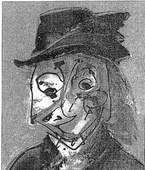
"Retrato nº 3", de Antonio Saura

Antonio Saura, aragonés de Huesca, empezó a pintar durante una larga enfermedad en 1947, un dibujo impulsivo en clima surreal que había superado el invierno de la Guerra Civil; durante su estancia en París, año 1953, descubre un arte "otro" con el que pronto se identifica, y su pintura incorpora elementos nuevos a una expresión que se rompe en vibraciones, con un tremendismo hecho carne, cuerpos, rostros, ese surco hondo que emerge a la superficie y se revela para constituir torrentes, como sucediera en Francisco de Goya y los discursos de otros autores contemporáneos. Fue la época en que, junto a artistas innovadores, Manuel Rivera, Feito, Rafael Canogar, Manuel Millares... dieron "el Paso" que marcó una serie de rumbos vitales en la aportación del arte español al informalismo y a una expresión de rostro celtibérico. Así fueron sur-