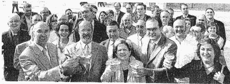
Los representantes de la sociedad vallisoletana brindaron con el periódico en septiembre del año pasado.

'Creciendo en Familia' y 'A pleno pulmón' (jueves); 'De Marcha' (viernes); 'Mi casa' (sábados) y 'De Domingo' (domingos).