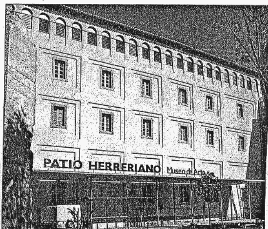
Una vista de la fachada principal del museo Patio Herreriano desde el Jardín.