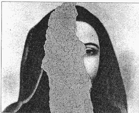
'Corona boreal', obra realizada por Carmen Calvo en 1999.

El Museo Patio Herreriano de Valladolid se ha sumado a los actos del vigésimoquinto aniversario de la Carta Magna con la exposición Cuatro dimensiones. Escultura en España, 1978-2003 , inaugurada ayer en un acto al que acudieron el presidente de la Junta, Juan Vicente Herrera, el secre-