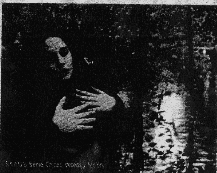
Sin título, 'serie Chicas, deseos y ficción'