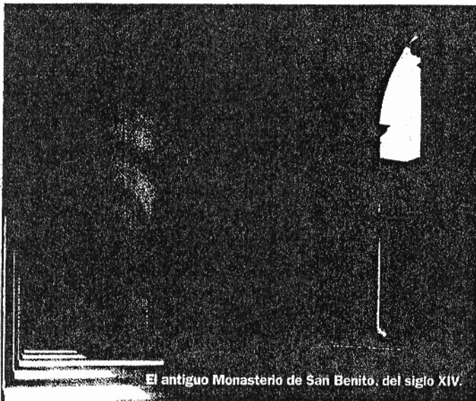
El antiguo Monasterio de San Benito, del siglo XIV.