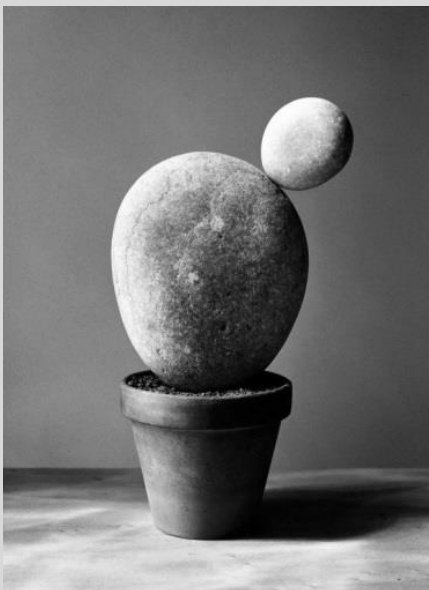
Chema Madoz. Sin título, 2000.