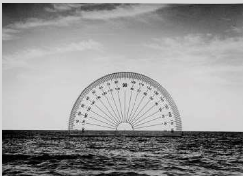
Chema Madoz. Sin título, 2007.

En esta exposición, la obra de Madoz se relaciona con artistas como Ángel Ferrant (1890-1961), Joan Brossa (1919-1998) o Perejaume (1957), que, al igual que él, han dirigido parte de su trabajo a las posibilidades expresivas de los objetos cotidianos y a sus significados cambiantes.