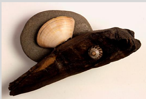
Ángel Ferrant. Ondina, 1945.