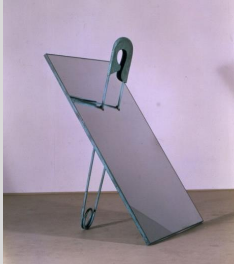
Perejaume. Cuore i mirall I, 1989.