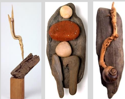
Ángel Ferrant. Pájaro de mar/ Pescador de Sada/ Extraño caracol, 1945.

En esta exposición, la obra de Ferrant se relaciona con la de artistas como Chema Madoz (1958), Joan Brossa (1919-1998) o Perejaume (1957), que, al igual que él, han dirigido parte de su trabajo a los objetos cotidianos atendiendo a sus posibilidades expresivas y al abanico de significados que contienen.